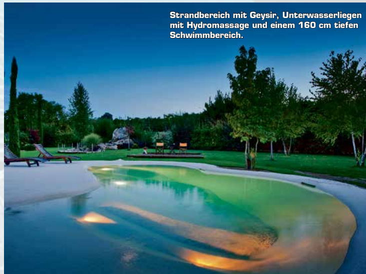
Strandbereich mit Geysir, Unterwasserliegen mit Hydromassage und einem 160 cm tiefen Schwimmbereich.

Unser Swiss SPA-Pool revolutioniert das klassische Konzept des Swimmingpools.