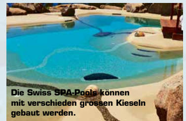
Die Swiss SPA-Pools können mit verschieden grossen Kieselsteinen gebaut werden.