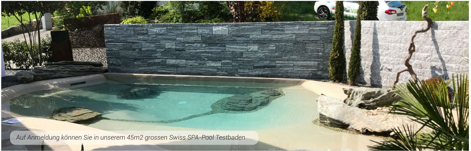
Auf Anmeldung können Sie in unserem 45m 2 grossen Swiss SPA-Pool Testbaden